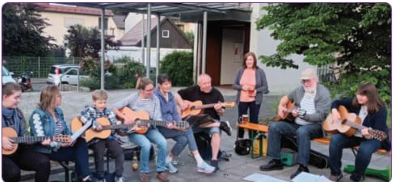
Unsere Gitarrengruppe nach der Sommerserenade auf dem Kirchplatz