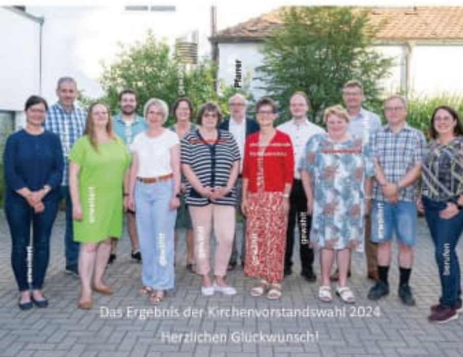
Das Ergebnis der Kirchenvorstandswahl 2024